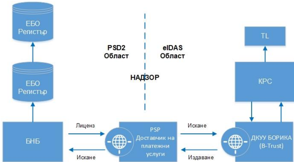
Фиг. 2. PKI участници в услугите на PSD2 – надзор (регулация)